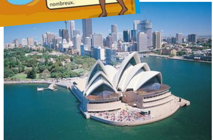
L'opéra de Sydney, haut lieu artistique