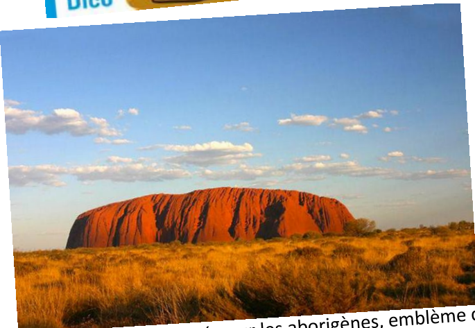
Ayers Rocks, lieu sacré pour les aborigènes, emblème de l'Australie classé au Patrimoine Mondial de l'Unesco