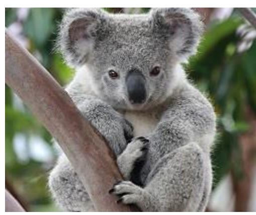
Aussi appelé paresseux australien, le koala est malheureusement une espèce menacée : en cause la déforestation et le changement climatique...