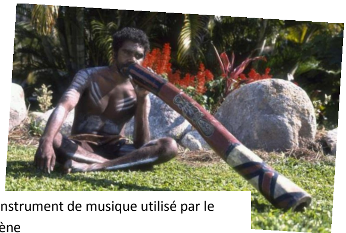
Le didgerido, instrument de musique utilisé par le peuple aborigène