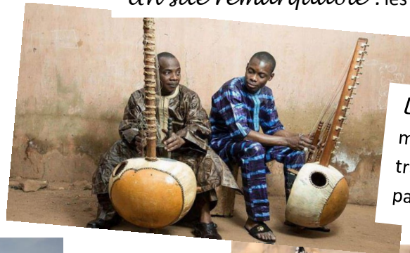
Les griots : des musiciens-poètes qui transmettent l'histoire du pays

Climat : 3 saisons (saison sèche - des pluies - et froide)