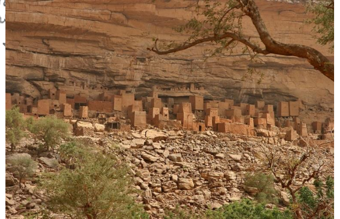
Un site remarquable : les Falaises de Bandiagara