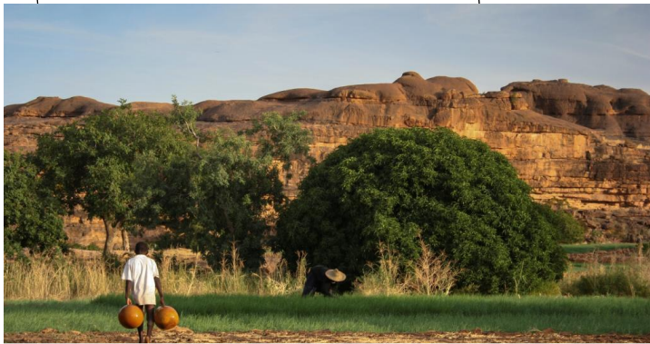
Un peuple qui vit surtout grâce à l'agriculture et à l'élevage des bêtes