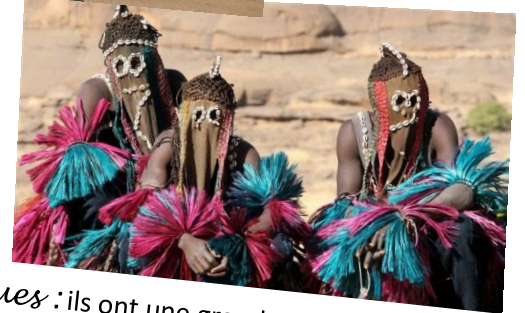
Les masques : ils ont une grande importance dans la culture malienne et sont très souvent utilisés lors de cérémonies