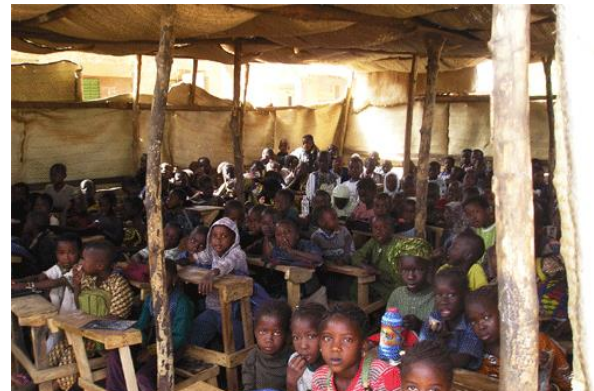
L'école : tous les enfants n'ont pas la chance d'apprendre. Et les classes comptent beaucoup d'élèves